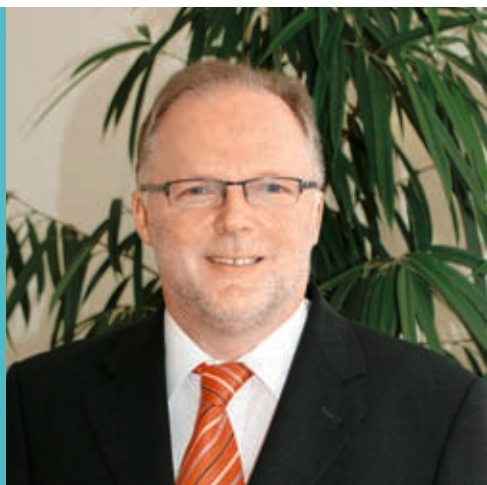
Lucien Lux, Ministre des Transports

Deux sujets me tiennent particulièrement à cœur : d'une part, la protection de l'environnement et, d'autre part, l'amélioration de la sécurité routière. Les nombreux efforts qui ont été déployés ces dernières années avaient tous comme objectif commun de satisfaire au moins à une de ces priorités. La promotion de la conduite écologique me permet d'agir simultanément sur ces deux défis clés de mon mandat.